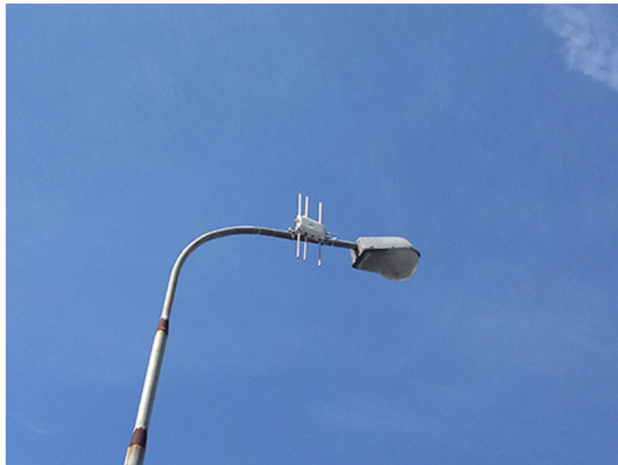
Photos of WiFi transceiver stations on the lampposts in Da Nang

At this time, I suddenly remembered that the leadership of Da Nang is installing and testing some WiFi broadcasting stations at certain routes and areas. I went around to see that WiFi stations were placed on high lamp posts in the following areas: Pham Van Dong Beach, along the length of Pham Van Dong Street, the intersection just before the Han River Bridge, Le Loi Street just before Phan Chau Trinh school (and some other roads, but I don't have time to go). I observed that a few dozen meters away, there was a station, the stations were located quite high, so I had to pay close attention to see it.